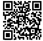
Nel QR Code: BrightSign, soluzioni per il Digital Signage

sistema Yamaha YVC-1000 , dotato di microfono e diffusore separati. È un diffusore full range che può essere posizionato vicino allo schermo, per una perfetta integrazione di audio e video dalla postazione remota, progettato per soddisfare i requisiti audio di sale e spazi riunioni di grandi dimensioni, anche con configurazioni particolari, come gli ambienti modulabili presenti in Quick . Completano l'opera i monitor touch Newline ATLAS da 75" e 86" , che consentono prestazioni veloci e interfaccia nativa 4K Android. Sono dispositivi